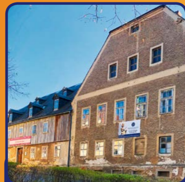
Schwesternhaus gebaut und erweitert zwischen 1770 und 1896