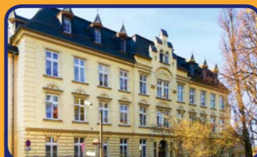
Dora-Schmitt-Haus Altenheim der Herrnhuter Diakonie