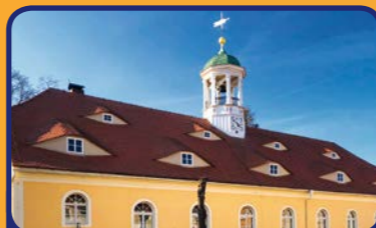
Kirchsaal erbaut 1758